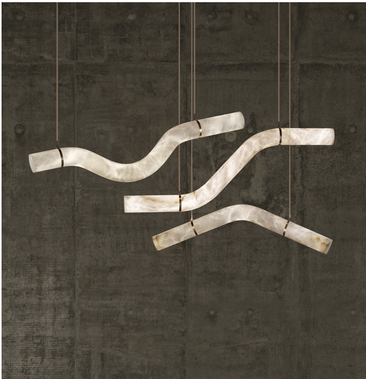
LIBERTY A / LIBERTY D / LIBERTY N